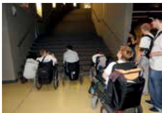
Egyetemes tervezési audit közben a Központ dolgozói, önkéntesei