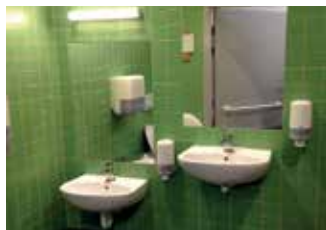
A Központtal szoros együttműködésben létrejött fogyatékos emberek számára is alkalmas családi mosdó